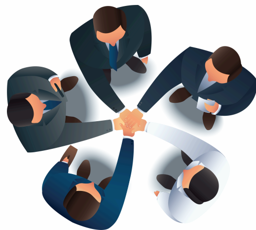
Doanh nghiệp, người sử dụng lao động