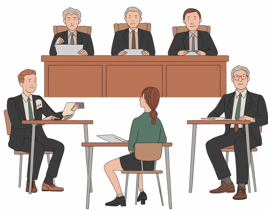
UBND cấp xã và người làm công tác trẻ em