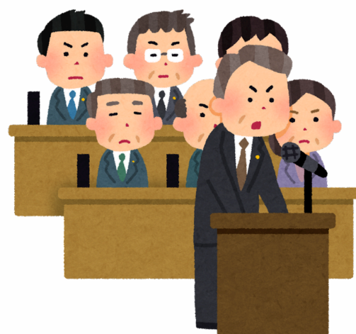
Các ban ngành đoàn thể tại địa phương