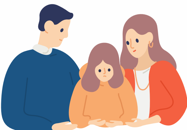
Cha mẹ, người giám hộ