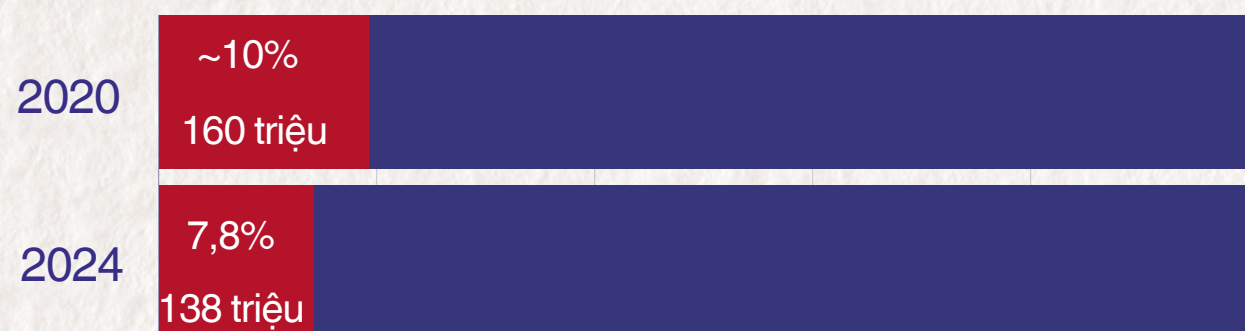
Tỷ lệ lao động trẻ em trên thế giới

Hoàn thiện chính sách, pháp luật về phòng ngừa, giảm thiểu lao động trẻ em